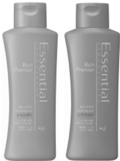
(写真1) ■「エッセンシャルシャンプー」 本体価格：オープン価格

今から18年前、花王(東京・中央区)の消費者相談窓口には、「シャンプーとリンスの容器が同じで分からないので形を変えてほしい」「洗髪時、目をつぶっていても区別がつかず助かる」「目が不自由なので、容器に工夫がほしい」などの要望が毎年数件ずつ寄せられていた。消費者の要望に答えるため、容器の研究を始めた花王